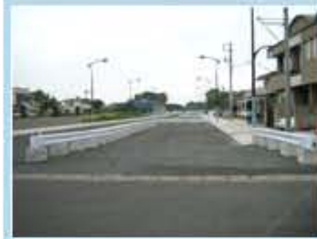
120型 茨城県水戸市千波町