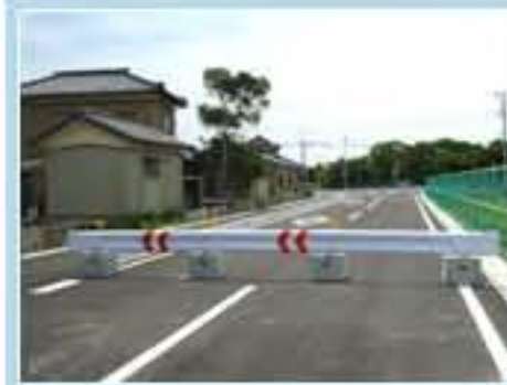
120型 茨城県神栖市波崎