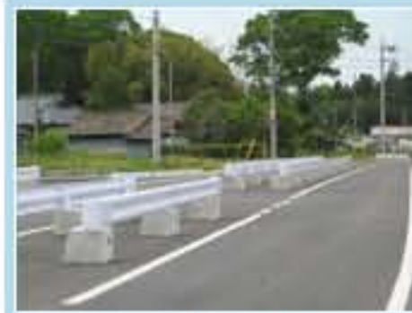
120型 茨城県小美玉市上吉影