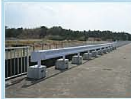
120型 茨城県神栖市南浜