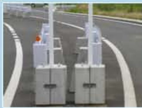
65型 茨城県小美玉市世楽