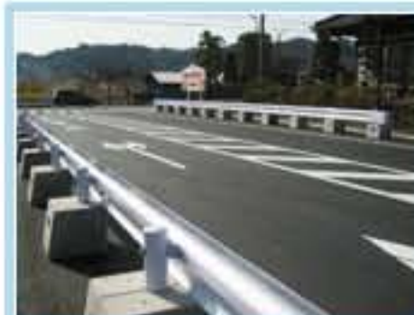
120型 茨城県常陸大宮市金井