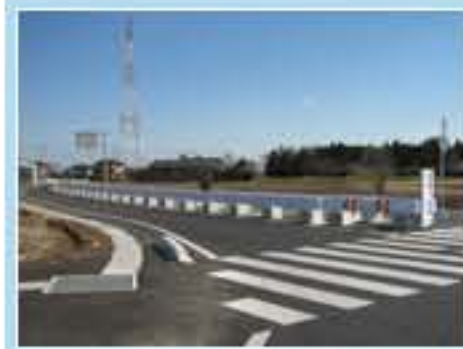
120型 茨城県那珂市菅谷