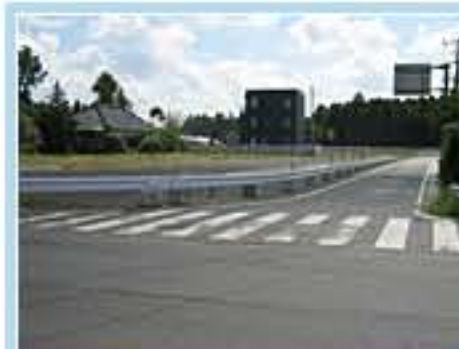
120型 茨城県小美玉市与沢