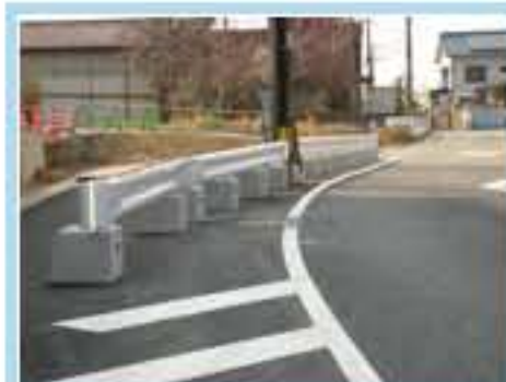
120型 兵庫県加東市高岡