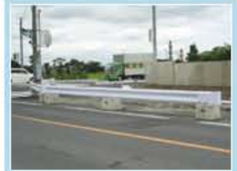
120型 茨城県水戸市吉沼町