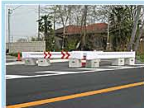
120型 茨城県筑西市岡芹