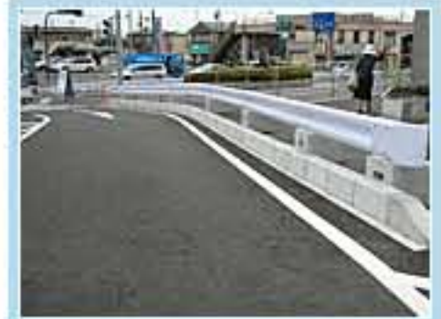
120型 茨城県常陸太田市山下町