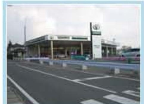
120型 茨城県小美玉市川戸