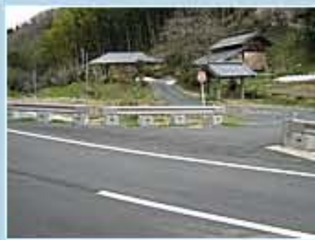
120型 茨城県常陸太田市大門町