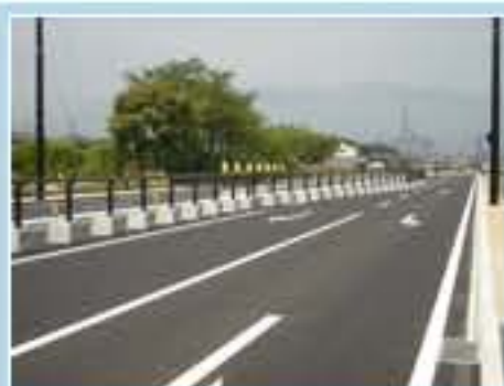
120型 福島県福島市唐橋