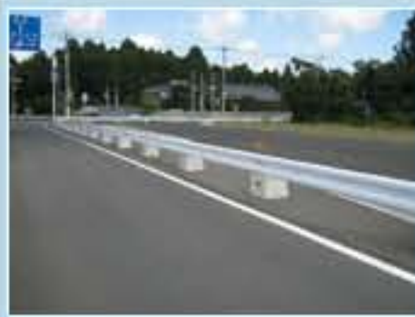
120型 茨城県小美玉市飯前