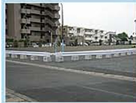
120型 茨城県水戸市元吉田町