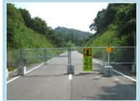
65型 茨城県常陸太田市町屋町