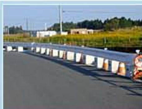
120型 茨城県水戸市藤井町