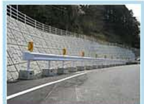
65型 茨城県大子町大沢